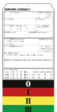
◆ 実際に使用されるトリアージ・タグ ◆