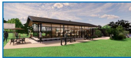
スターバックスコーヒー