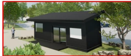
サービスセンター