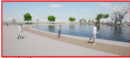
ジョギングコース