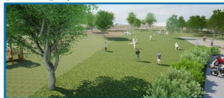
藤の広場(芝生広場)