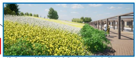
ガザニアの植栽(一部令和5年3月末完成)