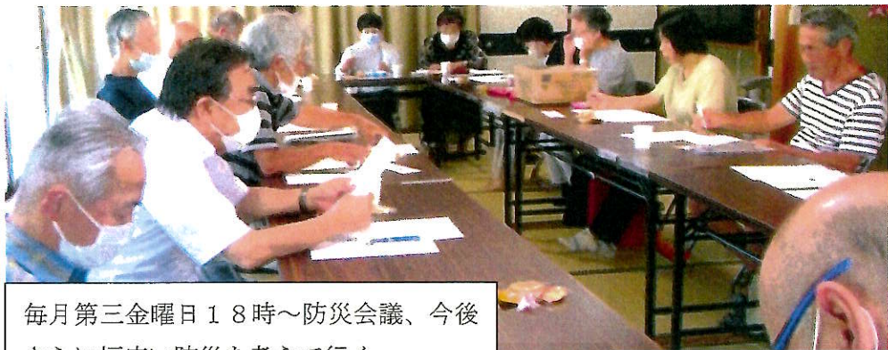
毎月第三金曜日 18時～防災会議、今後さらに幅広い防災を考えて行く