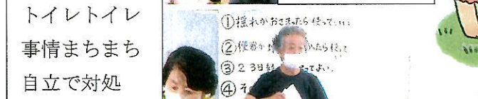
トイレトイレ 事情まちまち 自立で対処