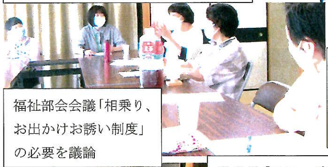
福祉部会会議「相乗り、お出かけお誘い制度」の必要を議論