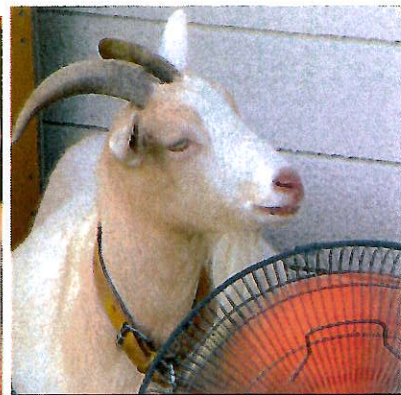
工業用扇風機が大好き。最強にしてスリスリ状態。