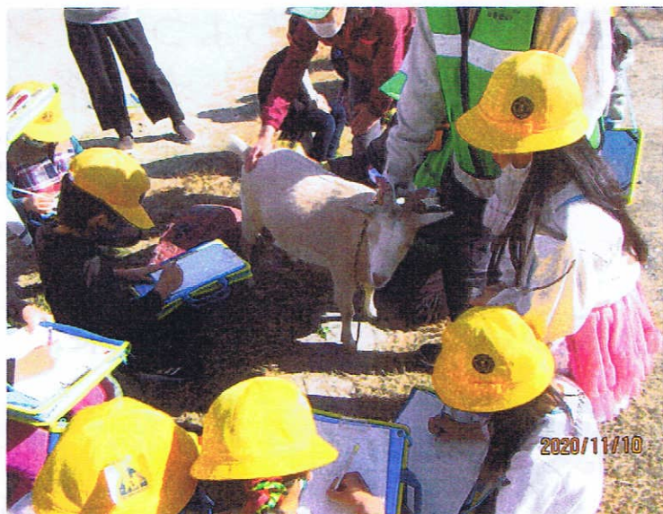
小学生の教材 ヤギのこと勉強してね