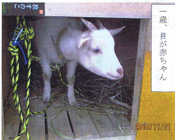
一歳、 目が赤ちゃん