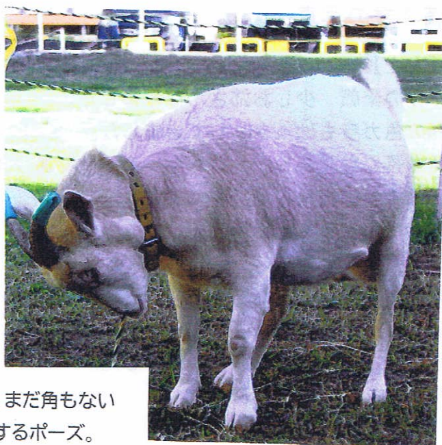
「ドン」の構え、まだ角もない 赤ちゃんでもするポーズ。

山羊の先祖(パキスタンやアフガン) ペゾール山羊 赤褐色 雌雄とも 角あり 肉髯あり 似ていないかな