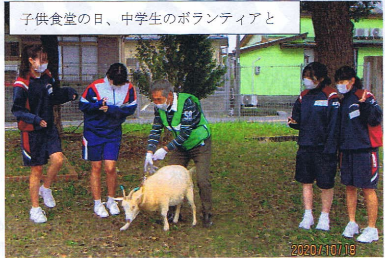
子供食堂の日、中学生のボランティアと

アセビ、キョウチクトウ、アジサイ、スイセン、チョウセンアサガオ、ツツジ、トクサ、ビワ、ナンテン、シキミ、ヤツデ、ツゲ