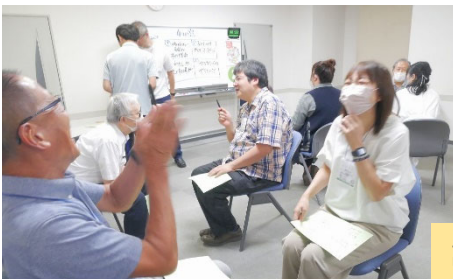
↑ 「プレイズファースト」の練習。アイデアを出すときに、まず褒めると、アイデアがたくさん出る!