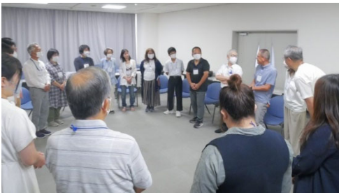
↑ みんなの顔が見えるよう円になって座り並び順を「バースデーリング」に!

簡単なゲームや自己紹介などをしながら、話しやすい「関係性づくり」やコミュニケーションのコツなどを学びました。