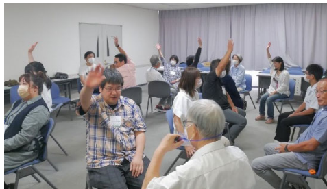
↑ 声を出したり、体を動かすことで参加のスイッチをオンに!