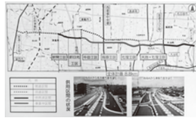
▲主要地方道 名古屋津島線バイパス事業区間