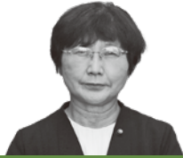
日本共産党議員団 太田幸江