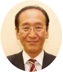
津島市長 日比 一昭