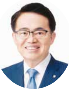
愛知県知事 大村 秀章

本年が、市民の皆様にとりまして、健康で幸せな年となりますよう心よりお祈り申し上げます。