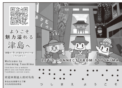
▲ステッカーデザイン(イメージ)