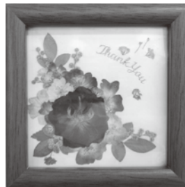
▲ミニバラで創る押花

申込 1月22日(月)・23日(火)の午前9時~午後5時に南文化センターで直接所定の申込用紙に必要事項を記入してください。