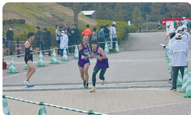
▲第16回のレースの様子