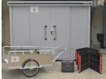
▲宝くじ助成金で配備された物品一式