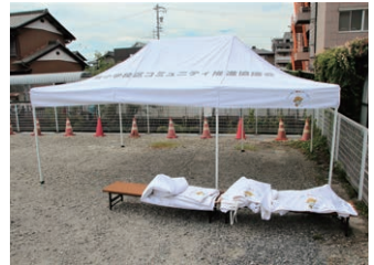
▲ワンタッチテント