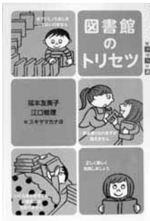
『図書館のトリセツ』 福本 友美子・江口 絵理 著 講談社

タイトルの言葉にある「トリセツ」とは取りあつかい説明書という言葉の短縮したものです。この本はそのタイトルの通り、図書館の利用についてくわしく説明した本です。