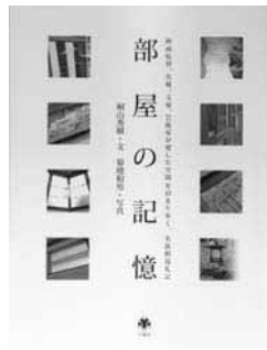
『部屋の記憶』 桐山 秀樹 文 菊地 和男 写真 六耀社

歴史上の人物や有名な作家、俳優など、安息の地を求めに足を運んだ旅館のお部屋を紹介した本です。