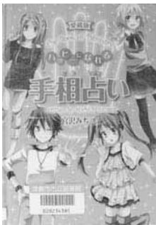
「ハッピーになれる手相占い」 宮沢 みち 著 金の星社