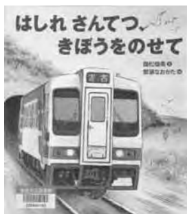
『はしれさんてつ、きぼうをのせて』 国松俊英 文 間瀬なおかた 絵 WAVE出版

岩手県の太平洋岸を走る三陸鉄道。ドラマ「あまちゃん」でも有名なこの鉄道会社は、東日本大震災で線路や駅舎が大きな被害を受けながらも、震災からわずか5日目には、一番被害の少なかった久慈—陸中野田間で列車を走らせました。