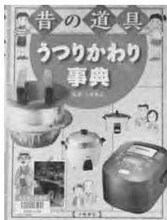
『昔の道具うつりかわり事典』 三浦 基弘 監修 小峰書店

すいはん器、洗たく機、冷ぞう庫。これらの道具は形も違えば、使い方も違います。今の道具になったのはいつ頃でしょう。