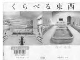
『くらべる東西』 おかべ たかし 文 山出 貴士 写真 東京書籍

この本では、関東と関西の「おでん」「座布団」「タクシー」から「落語家」「名山」まで、全部で34の違いを写真に撮って、ひと目でわかるように紹介しています。