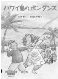
『ハワイ島のボンダンス』 いわね あい ぶん おとも やすお え 福音館書店

小学生のまさるは、おばあちゃんのお姉さんに会いに行くために、お父さんと車いすのおばあちゃんといっしょにハワイに向かいます。はじめてのハワイで、食べものや火山、日本の食材がたくさんあるスーパーマーケットなど、たくさんの発見をします。