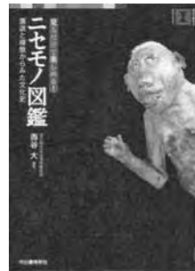
『ニセモノ図鑑』 二宮 敦人 著 河出書房新社

徳川家康の書、雪舟の絵といった有名な書画から、天目茶碗などの当世人気の陶磁器まで、日本には本物以上に「ニセモノ」といわれるものが存在します。この本は各地で発見された「ニセモノ」を歴史的観点から幅広く取り上げ、鑑定のポイントを詳細に解説しています。中でも長い歴史のある「人魚」のニセモノは、日本書紀の記述から始まり、名古屋城下で見世物になった江戸時代までを紹介しており、当時かなりの人気があったことが分かります。