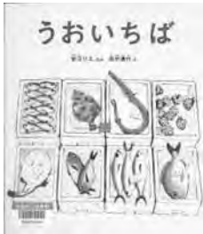
『うおいちば』 安江リエ 文 田中 清代 絵 福音館書店

みなさんがよく食べているお魚。お店にならぶ前は「うおいちば」という所でお魚が売り買いされています。そのうおいちばではたらいているのがきよちゃんの家族です。