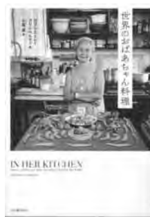
『世界のおばあちゃん料理』 ガブリエーレ ガリンベルティ 著 小梨 直 訳 河出書房新社

皆さんの家に家庭の味があるように、世界中には様々な家庭の味があります。そして、その味を守り次の世代へと伝えているのがおばあちゃんです。