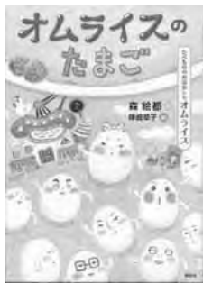
「オムライスのだまご」 森 絵都 作 陣崎 草子 絵 講談社

たまごのタマキのゆめはオムライス。お姉さんたまごといっしょにバックにつめられ、お店のたなでお客さんに買われるのをまっています。