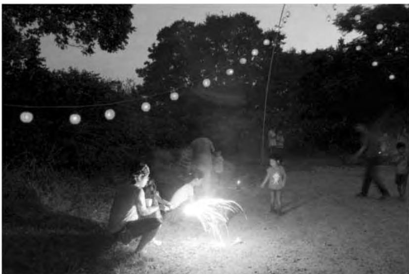
提灯を飾り、花火をする

文化庁が、重要無形民俗文化財以外の無形の民俗文化財のうち、特に必要があるものを選択し、その保護を図る制度。特に変容・衰退の恐れが高いものについては計画的に映像・報告書により記録化を進め、確