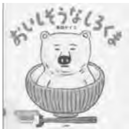
『おいしそうなしろくま』 柴田 ケイコ 作・絵 PHP研究所

おいしいものをたべるのがだいすきなしろくまは、みんなから「くいしんぼうのしろくま」とよばれています。すききらいはもちろんありません。なんでもおいしくいただきます。あるひ、「たべものなかにはいったらどんなかんじかな?」とおもいます。「ごはんのなかってふわふわしてあたたかいだろうなあ」、「うどんにのったあじがしみこんだふわふわなあげをおふとんにしてみたいなあ」、「みんなではじけてポップコーン!」…そうぞうしただけでたのしくなり、おなかがぺこぺこ。さて、きょうのよるごはんはなにかな?