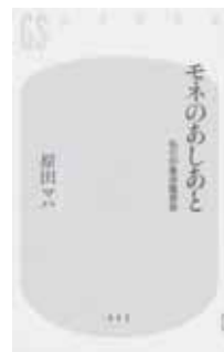
『モネのあしあと 私の印象派鑑賞術』 原田 マハ 著 幻冬舎

印象派を代表するルノワール、ゴッホ、セザンヌは、かつてフランスアカデミーの反逆児でした。その先駆けともいべき画家がクロード・モネ。1873年作の《印象一日の出》が「印象のままに描いた落書き」と酷評されたのが「印象派」のはじまりです。風景の一部を切り取る構図、筆跡を残す絵筆の使い方、モチーフの極端な抽象化、見るものを絵に引き込ませる術をモネはどのように手に入れたのでしょうか?美術館勤務経験があり、キュレーターでもある小説家ならではの視点で、モネのミステリアスな人生と印象派の流れを徹底解説します。