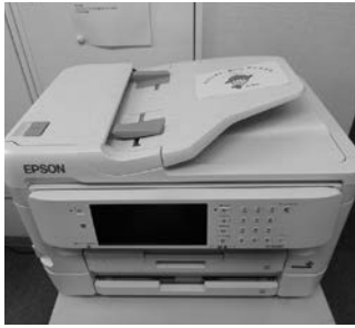
▲インクジェット複合機