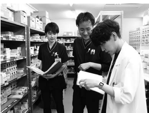
▲抗菌薬が適切に使用されているか確認している様子