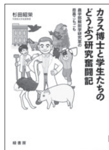
『カラス博士と学生たちの どうぶつ研究奮闘記』 杉田 昭栄 著 緑書房

ふとしたきっかけでカラスの研究をはじめ、「カラス博士」と呼ばれるようになった著者。