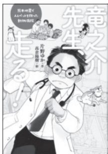
『竜之介先生、走る!』 片野 ゆか 作 高倉 陽樹 絵 ポプラ社