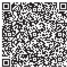
▲あいち電子申請システム

申込 11月5日(火)～15日(金)に電話(土日曜日は除く)、市ホームページまたは専用ホームページからお申し込みください。