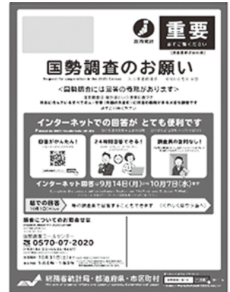
▲この封筒が配布されます