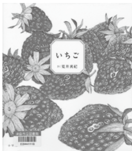
『いちご』 荒井 真紀 作 小学館

あまくて、見た目もかわいいいちご。いちごをかんだ時の、ぷちぷちという音は、何をかんだ時の音か、わかりますか。