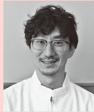
津島市民病院 外科医長