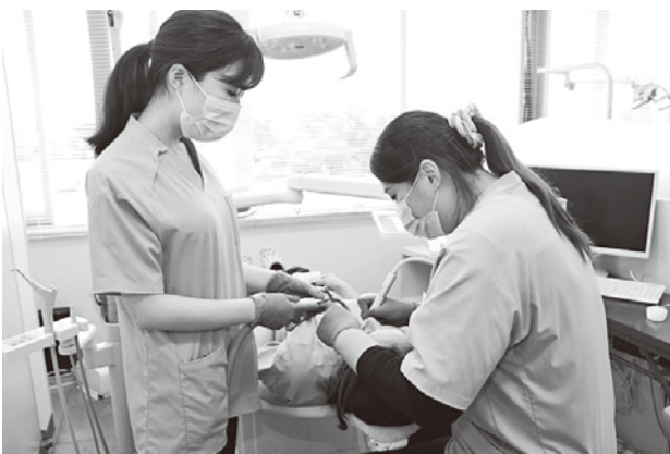
▲歯科予防処置の様子

今回のインタビューでは、市民病院の歯科衛生士によるきめ細かな配慮が患者さんの不安を取り除くことにつながっていることがわかりました。