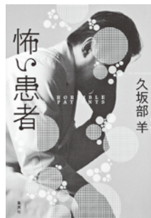
『怖い患者』 久坂部 羊 著 集英社

区役所で勤務する愛子は、同僚から陰口を聞いたことをきっかけに「発作」を起こすようになる。それから何度か「発作」を起こし、心療内科で、「パニック障害」と診断されるが、納得のいかない愛子はドクターショッピングを繰り返して……。〔天罰あげる〕