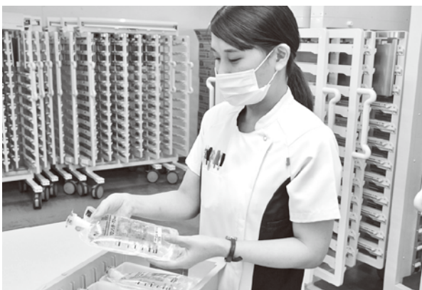
▲薬を準備している様子

A. 病棟薬剤師に限った話ではありませんが、日々新しい薬が開発されるため、学び続ける必要があることです。また、服用方法が複雑な薬も多く出てきており、正しく患者さんが服用できるように私たち薬剤師も努力が必要ですよ。