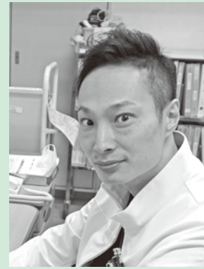
津島市民病院 循環器内科医師