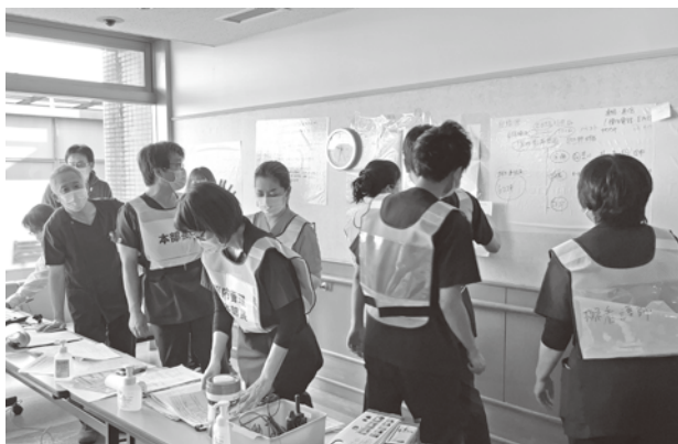
▲激甚災害訓練の様子

災害拠点病院である市民病院では、災害時に発生しうるあらゆる事態を想定した訓練が定期的に行われています。とが分かりました。また、災害時に被災者の生命を守るための専門的な研修訓練を受けたDMATの存在がとても頼もしく感じました。