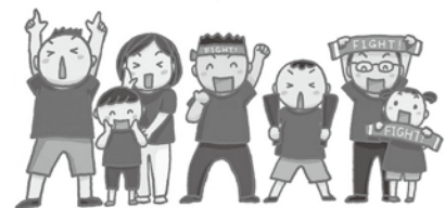
▲ふるさと津島応援広報大使と津島応援団(イメージ)

新型コロナウイルス感染症を取り巻く状況は、昨年の1月に国内初の感染者が確認されて以降、3月の小中学校・高校の一斉休校、4月の緊急事態宣言による外出自粛や休業要請など感染を抑え込む対策・取組から、緊急事態宣言が解除された6月以降は感染拡大防止対策を講じつつ、社会経済活動を再開する取組へと移行してまいりました。