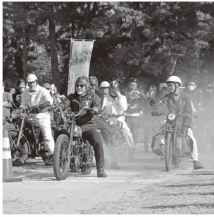
▲ビンテージバイク走行実演

また、日本の歴史公園100選である天王川公園においては、開設100周年を記念して、当時開催された草競馬の様子を描くライブペイントや、大正から昭和にかけて開催されたオートレースを偲ぶビンテージバイクの走行実演などのイベントを11月の休日に開催し、多くの人で賑わいました。