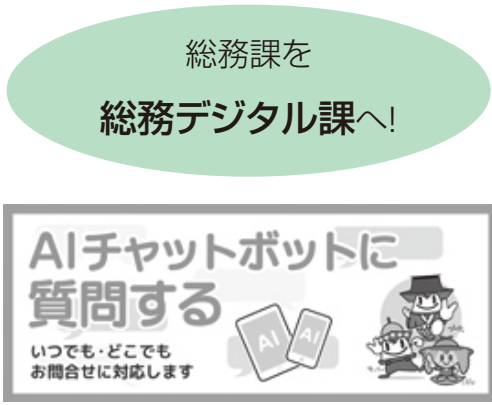
▲AIを活用した総合案内サービスのバナー

本市におきましては、昨年11月からAIを活用した総合案内サービスや、AIを活用して文字認識を行うA-OCRシステムなど新たな取組を始めるとともに、本年4月からは市県民税などの納付方法にスマートフォン決済アプリでの納付を加えることとしており、今後とも一層のデジタル化の推進が必要であると認識しております。