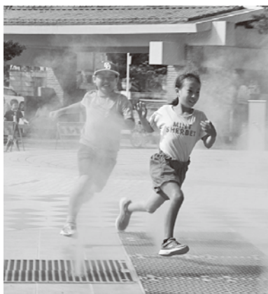
▲天王川公園で遊ぶ子どもたち

昨年9月に公表された2019年の人口動態統計(確定数)において、我が国の出生数は86万人台となり、統計開始以来、初めて90万人を下回り、少子化に歯止めがかからない状況にあります。このように厳しい状況ではありますが、子どもを産み、育てやすい環境の実現を目指し、子どもが生まれる前から産み育てるまで、丸ごと応援するための施策を推進してまいります。