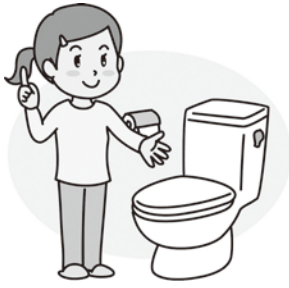
▲全小中学校のトイレ洋式化 (イメージ)

未来を担う子どもたちの豊かな学びや成長を支えるために、より良い教育環境を整備していくことは、学校設置者である私に課せられた使命であります。