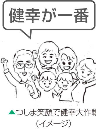
▲つしま笑顔で健幸大作戦 (イメージ)

さらに、すべての世代の健康づくりを推進するため、愛知県と市町村とが協働して実施している健康マイレージ事業については、令和3年度からスマホアプリが使えるよう拡充し、「つしま笑顔で健幸大作戦」と名付け展開してまいります。