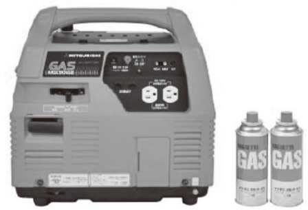
▲ポータブルガス発電機

さらに、令和2年度には災害時に活用可能なポータブルガス発電機が、7月から返礼品に加わったことに伴い、寄附金額はさらに増加しており、昨年4月から12月までの9カ月間で2億7437万円となっております。