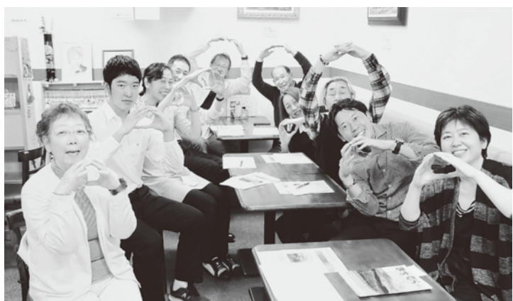
▲インフィニティハッピー賞受賞時の写真

今後も、さらなる市勢伸展のため、議員各位、並びに市民の皆様の一層のご理解とご協力をお願い申し上げます。