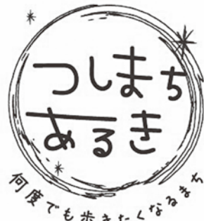
▲つしまちあるきキャンペーン ロゴマーク

まさに、「コロナ禍で求められる新しい観光のあり方を反映した」少人数によるまち歩き」が、好評を博したものと思っております。引き続き、令和3年度も第2弾として「つしまちあるきキャンペーン」を実施してまいります。