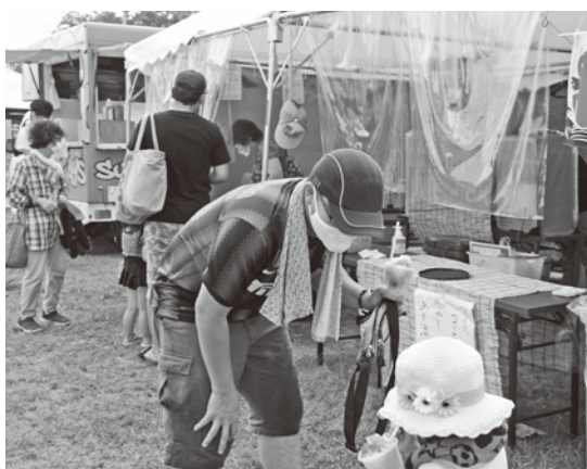
▲天王川公園での社会実験の様子

この成功体験をもとに、民間事業者の持つノウハウやアイデアを最大限活かし、いつ訪れても賑わっている公園となるよう、引き続き、取り組んでまいります。