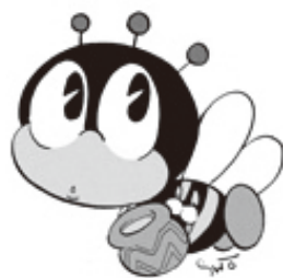
▲生涯学習マスコット「マナビ」