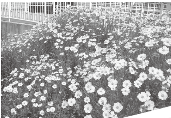
▲オオキンケイギクの花

5～7月ごろにかけて鮮やかな黄色の花を咲かせる多年草です。高さは40～80cm程度で、葉は細長い楕円形で両面に毛があります。繁殖力が強いので、在来の植物との競合や駆逐が懸念されています。特定外来生物に指定されていますので、駆除する際は、その場で枯死させた後、密封されたビニール袋等に入れてごみとして出してください。