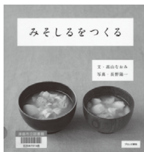
『みそしるをつくる』 高山 なおみ 文 長野 陽一 写真 ブロンズ新社