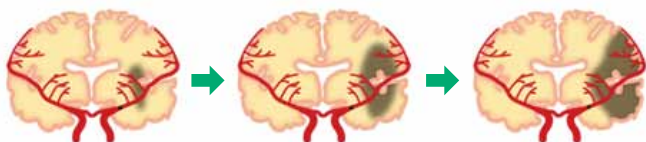
時間と共に脳梗塞の範囲は拡大します

脳梗塞の治療は日々進歩しており、最近ではカテーテルを使った治療を行うことで、社会復帰が可能な人が増えています。そのためには、なるべく早く治療を行うことが必要です。