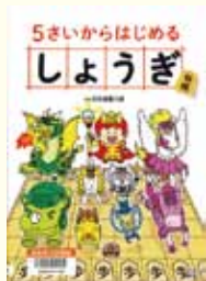
『5さいからはじめるしょうぎ』 杉本昌隆 監修 日東書院本社