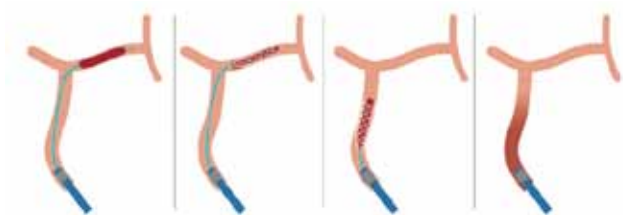
ステントにて血栓を捕捉しカテーテルの中に引き込み再開通させます

早い段階での再開通は脳梗塞の範囲を最小限にとどめることができ予後改善にもつながります。