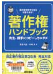
『著作権ハンドブック』 宮武久佳 著 大塚 大 著 東京書籍

人気のキャラクターを無断使用、海賊版DVDを販売した……など、著作権に関連したニュースをみかけませんか？