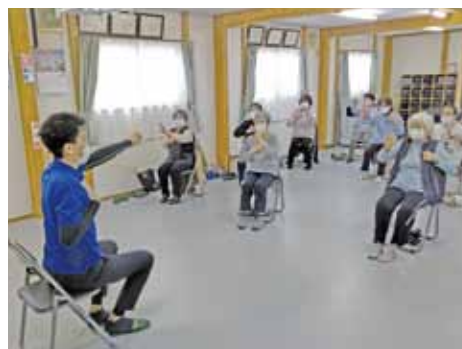
「ひとやすみ」への講師派遣の様子 毎週火曜日、午後1時30分から開催