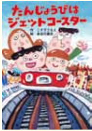
『たんじょうびはジェットコースター』 ごすぎさなえ 作 長谷川義史 絵 PHP研究所

もうすぐ、ぼくの7さいのたんじょうび。ママからどこへ行きたいかきかれ、ぼくは「ドリームランドにいきたい!」といった。だいすきなキャブテンズのアトラクションに乗ったり、キャブテンズといっしょに写真をとることをとっても楽しみにしていた。それなのに、ドリームランドまであと3日になったころ、なんとなくのどがいたくて、からだがだるい。思いかえせば、いつも楽しみにしていたおでかけにかぎってねつが出た。おねえちゃんは「ひごろのおこないがわるいからや」っていうけれど…。