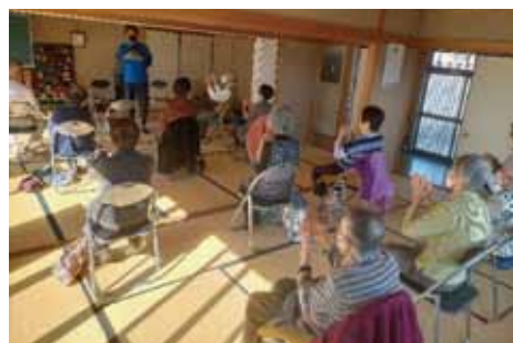
「ふれあいの郷」への講師派遣の様子 毎週火曜日、午前9時から開催