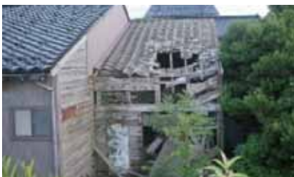
適切に管理されていない空家の事例

建物は人が住まなくなることにより急速に傷みが進みます。建物の所有者の方等は、近隣に悪影響が及ばないよう、適切な管理をお願いします。