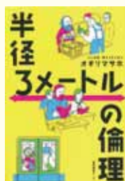
『半径3メートルの倫理』 オギリマサホ 著 産業編集センター

私たちの生活の中にはいろいろな悩み事があります。その中には、周りから小さな悩みと思われても、自分にとっては大きな悩みとして抱えている場合があるかも知れません。この本は、そういった身近な悩みについて、世界中の哲学者からアドバイスをもらえる内容となっています。