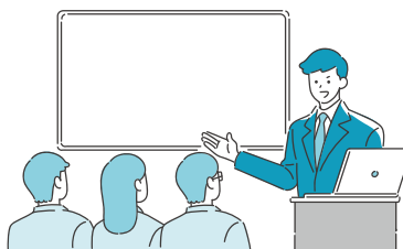
▲リスキリング(イメージ)

デジタル化は市民の利便性の向上だけでなく、職員の働きがい改革の実現により、市民と職員の両方のしあわせの実感につながります。そのためには、先ほども申しあげました、