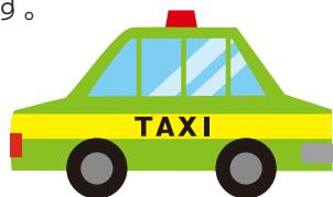
▲おでかけタクシー(イメージ)

「おでかけタクシー事業」の推進により、高齢者や障がいのある方などに寄り添った移動支援を進めてまいります。