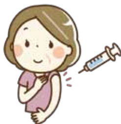
新型コロナウイルス ワクチン接種イメージ

こうした中でも、非常に厳しい状況に置かれている市民の皆様や事業者の皆様へ支援を届けるため、①感染拡大の防止、②市民の暮らしの支援、③子育て・教育支援、④地域経済の支援といった4つの支援が必要と考え、これまで様々な事業を実施してまいりました。令和2年度から実施してまいりました新型コロナウイルス感染症対策事業第1弾から第11弾までを含め、これまでに実施いたしました新型コロナウイルス感染症関連事業は、112事業、事業費といたしましては約109億7,900万円となります。これらの事業は、コロナの感染状況や市民の皆様・事業者の皆様の状況に合わせて、しっかりと対応しており、大きな成果があったと考えております。