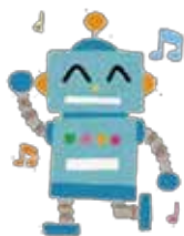
人型ロボット (イメージ)

放課後子ども教室にも、ブロックで自由な形を作り、プログラミングによって様々な動きを与えて遊ぶロボット・プログラミング学習機材を導入します。