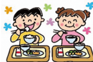
給食費の無償化(イメージ)

して、9月から来年3月まで7か月で総額約2億円の「小・中学校、保育所・認定こども園・幼稚園給食費の無償化」など、様々な事業展開をしてまいります。