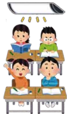
▲全小中学校の照明をLED化(イメージ)

子育て環境の充実に関しては、これまで中学校卒業までの子ども医療費の完全無料化を始めとする子育て支援の充実や、全小中学校へのエアコン設置、全小中学校トイレの洋式化を始めとする学校環境の充実などに取り組んでまいりました。今後も全小中学校の照明をLED化するグリーン(脱炭素)事業や老朽化した学校屋内運動場の大規模改修など、引き続き子育て環境の充実を図るとともに、日本一のプログラミング教育を