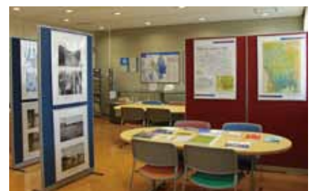
▲自助・共助防災学習センター

自然災害への備えとして、昨年3月に生涯学習センター内にオープンいたしました「自助・共助防災学習センター」には、避難所用テントや段ボールベッドなど、避難生活で使用する物品や、災害時の写真パネルの展示、