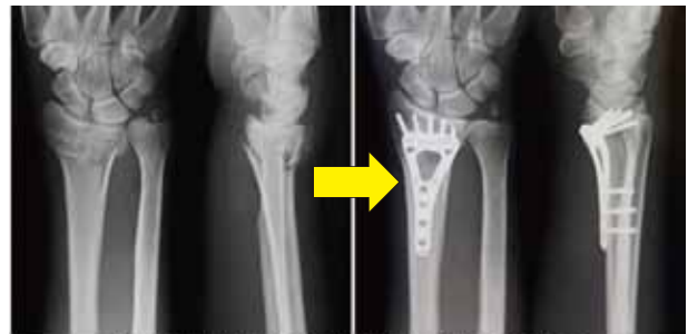
橈骨遠位端骨折 手術前(左)と骨接合術後(右)

子どもの場合は、骨折部の整復が不完全でも自力での矯正力が強く、骨のくっつき(癒合)も早いので手術を必要としない場合もあります。