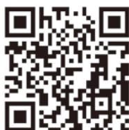
国土交通省ホームページ