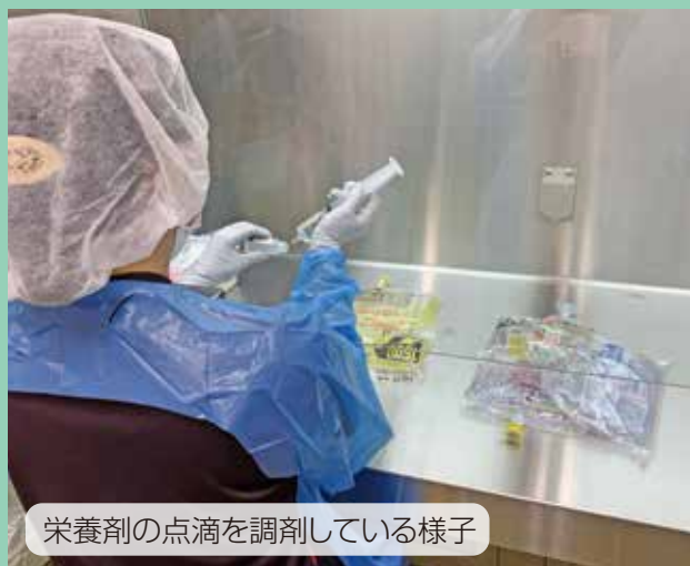
栄養剤の点滴を調剤している様子

主に入院患者さんの薬を調剤し、薬の量や飲み方、飲み合わせを確認します。口から薬を飲むことが難しい入院患者さんには、粉碎したり溶かしたりした薬を、鼻やおなかに入れた管を通して投与することもあります。薬の性質によってはそれができない場合もあるため、同等の効果がある別の薬への変更を医師に提案しています。