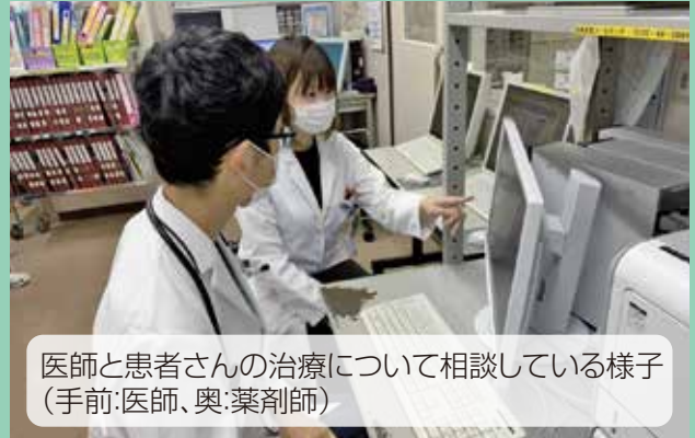
医師と患者さんの治療について相談している様子 (手前:医師、奥:薬剤師)

入院患者さんが退院される際には、病院からお渡しした薬と入院前に使用していた薬が混ざり、誤った薬を飲んでしまわないように、薬の管理を行っています。また、入院中に薬の変更があった場合は、他の病院や調剤薬局の医療従事者が分かるように、お薬手帳への記載やかかりつけの調剤薬局へのFAXを通して情報提供をしています。