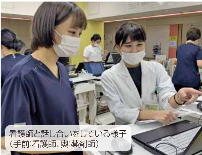
看護師と話し合いをしている様子 (手前:看護師、奥:薬剤師)

患者さんの治療には様々な医療スタッフが関わっています。その中で薬剤師は薬物療法の方針について医師と話し合いをしたり、看護師から薬剤の使用方法や注意点について相談を受けることが多くあります。このような連携を行うことによって、患者さん1人ひとりの最適な治療に貢献できるように日々努力しています。