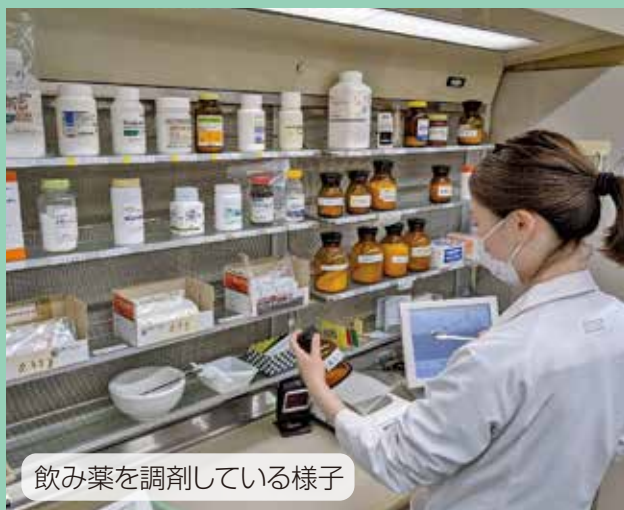
飲み薬を調剤している様子