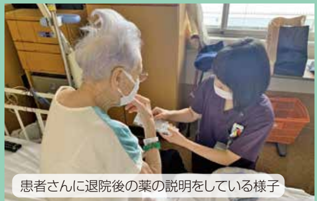
患者さんに退院後の薬の説明をしている様子