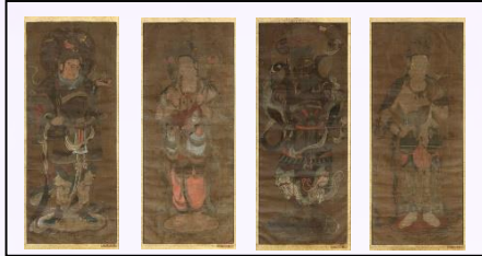
絹本著色十二天画像