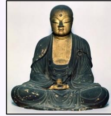
木造地藏菩薩坐像