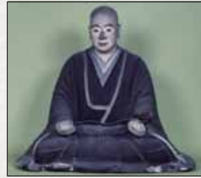
木造弥阿上人坐像 (貞和三年在銘)