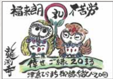
※詳細は龍瀧寺のInstagram(@ryuenji_oizousama)をご確認ください。