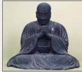
木造一向上人坐像 (文明二年在銘)