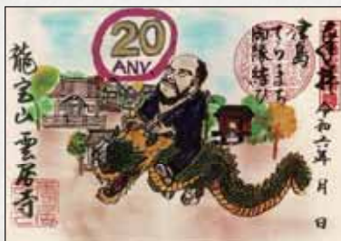
※詳細は雲居寺のInstagram(@ryuhozanungoji)をご確認ください。