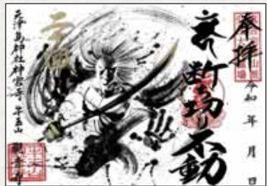
※詳細は観音寺のX(@kannonji81)をご確認ください。