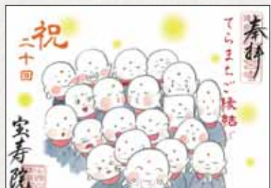
※詳細は宝寿院のInstagram(@houjuuin.yakushi)をご確認ください。