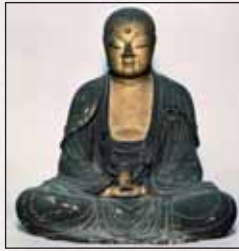
木造地藏菩薩坐像