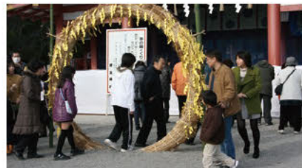
띠 고리 통과하기