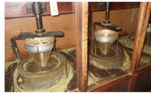
차 가게의 말차를 가는 맷돌