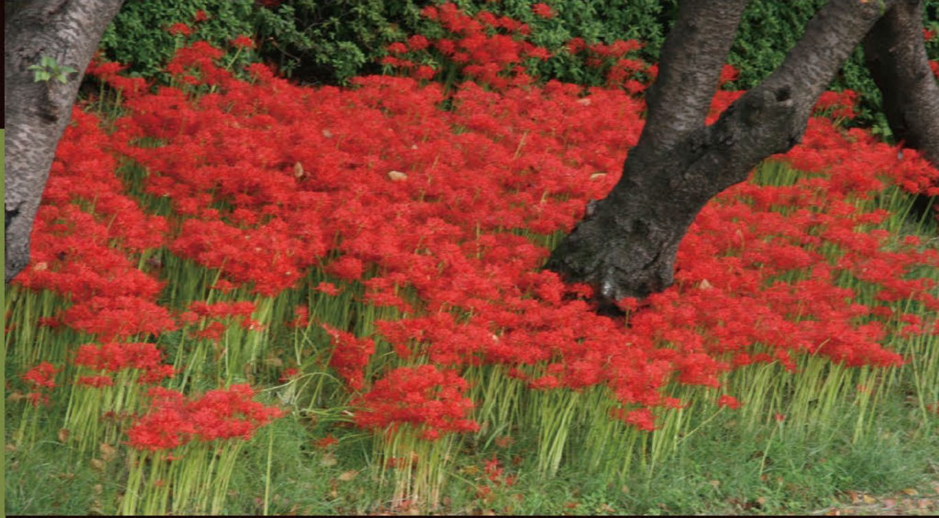
덴노가와 공원 제방을 물들이는 석산

덴노가와 공원에서는 가을의 추분에 맞춰 석산화가 피며, 선명한 꽃의 색이 보는 이를 매료시킵니다.