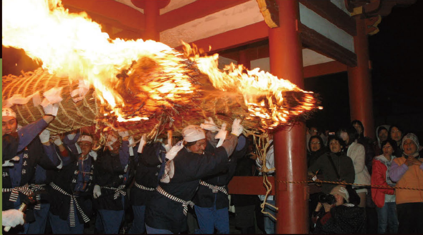
오미토마쓰리 봄을 알리는 불 축제