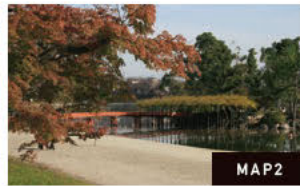
⑧연못을 화려하게 수놓는 모습 (가을의 단풍과 은행)