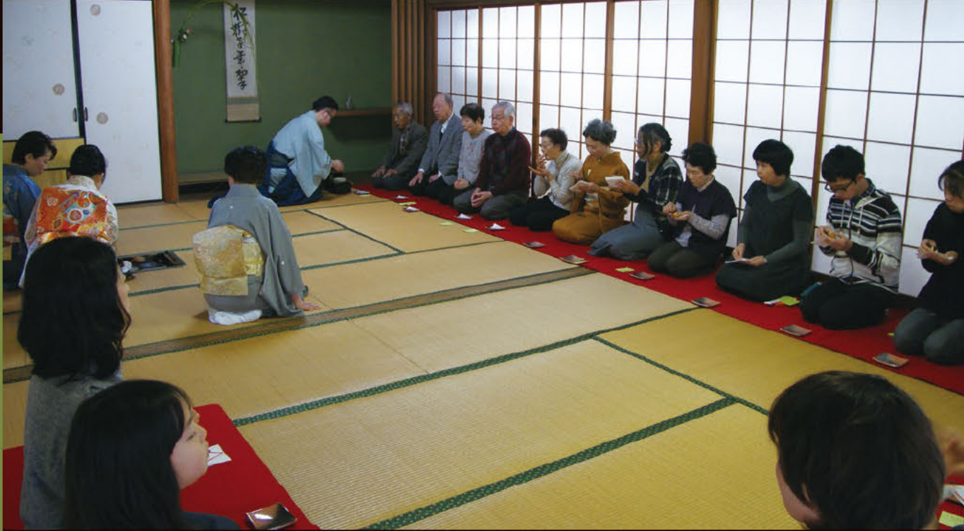
첫 다회 쓰시마에 뿌리내린 '차' 문화

첫 다회란 새해 들어 다도의 연습을 시작하는 날을 가리키며, 다도의 신년회라 할 수 있습니다. 쓰시마 시내 여기저기서 첫 다회가 치러집니다.