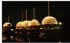
①영웅의 꿈을 태운 덴노마쓰리 (오와리 쓰시마 덴노마쓰리)

원을 물들이는 계절의 변화는 아름다우며, 사계절의 풍경은 덴노가와 팔경으로 널리 사랑받고 있습니다.