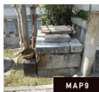
도게 신사 우물