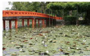
③주위를 둘러싼 수련 (수련)