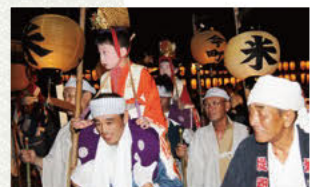
어린이 행차(밤 축제 전야) 화려한 의상을 입은 어린이가 목마를 타고 축제용 배에 가서, 쓰시마 신사에서 축제가 무사히 치러지길 기원합니다.