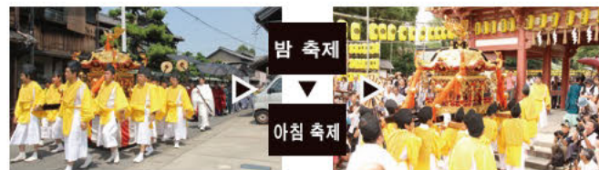
신여 행차(밤 축제 당일 아침) 100미터에 이르는 화려한 행렬이 이어지며, 쓰시마 신사에서 덴노가와 공원으로 신여(神輿)가 운반됩니다.