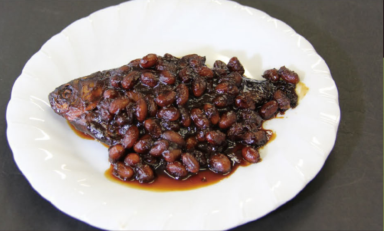
후나미소 시대를 넘어 전해져 온 향토요리

향토요리에는 지역의 역사나 문화, 생활이 한 점시에 담겨 나옵니다. 쓰시마는 그 옛날, 기소가와 강 하구의 항구도시로 번영했습니다. 때문에 붕어, 모로코(잉어의 일종), 장어 등을 쓴 민물고기 요리가 향토의 전통요리가 되었습니다.