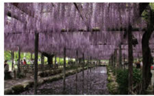
⑥수로를 물들이는 등꽃 무리 (등꽃 시령)