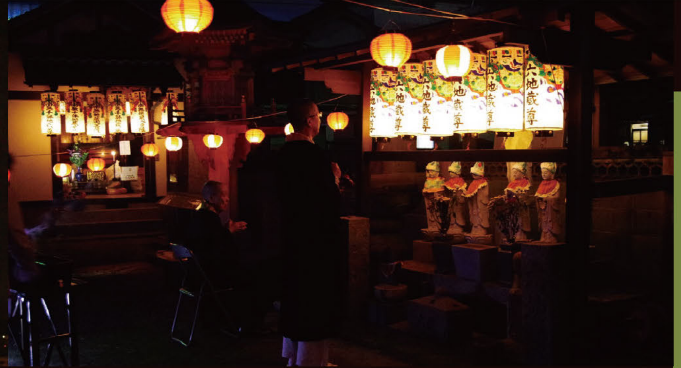
지조본 여름의 끝을 알리는 지조본

매월 24일은 지장보살의 갯날로, 8월의 우란분제 다음의 갯날을 지조본이라고 합니다. 지조본 행사는 주부, 간사이 지역, 특히 교토를 중심으로 한 긴키권에 집중되어 있습니다. 아이들을 지키는 부처님인 지장보살께 감사하고 지역 아이들의 성장을 기원하는 행사로, 쓰시마 시내에서도 여기저기에서 지조본이 개최됩니다. 쓰시마에서 만날 수 있는 지장보살의 일부를 소개합니다.