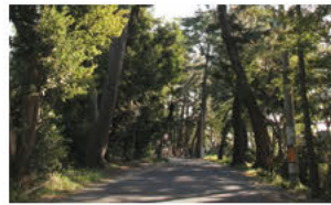
⑦옛길의 제방 (나카지 제방의 벚꽃 가로수)