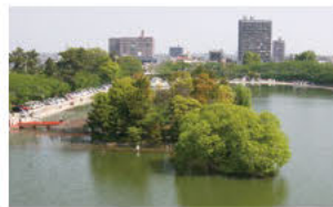
④봄결같이 떠 있는 나카노시마 (나카노시마와 미요시지마)