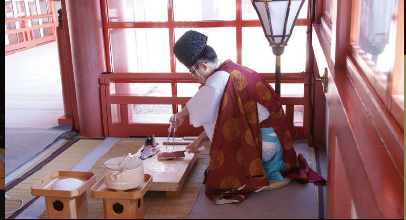
마나바시 요리 신께 바치는 요리

잉어에 일체 손을 대지 않고 식칼과 마나바시만으로 요리하는 일본의 전통 기술. 마나바시란 물고기를 요리할 때 쓰는 자루가 달린, 목재나 철재로 만든 긴 젓가락입니다.