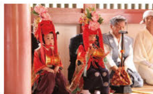
어린이 주악(아침 축제 당일) 신여가 귀환한 뒤, 신체(神體)가 돌아온 쓰시마 신사의 배전에서 어린이들의 연주가 거행됩니다.