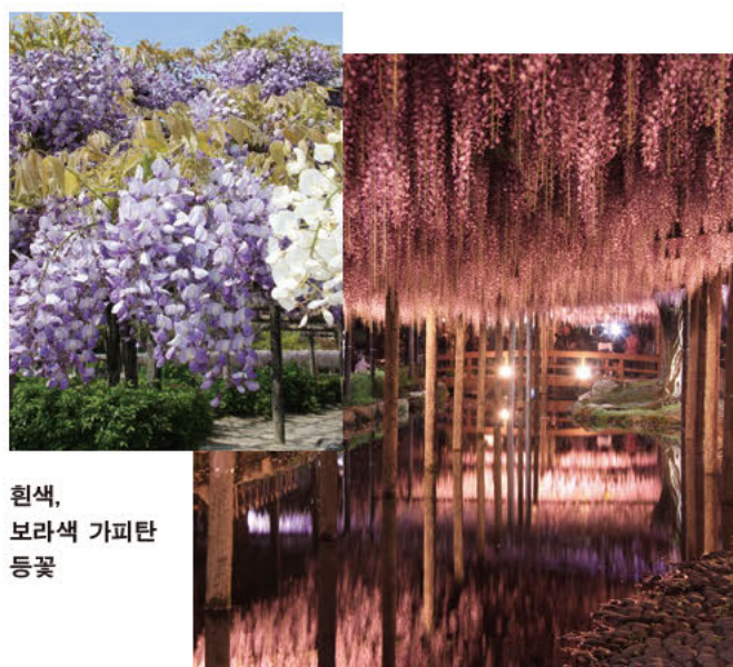
흰색, 보라색 가피탄 등꽃

향기를 뿜어냅니다. 등나무 시렁 밑으로 흐르는 수로의 수면에 비치는 등꽃은 매우 아름답습니다. 축제 기간의 밤에는 라이트업이 켜지는데 찬란하게 빛나는 환상적인 등꽃의 아름다움은 특별합니다.