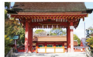
도요토미 히데요시의 아들, 히데요리가 기증한 남문

오다 노부나가는 쓰시마 신사를 고향의 신으로 깊이 믿었다고 하며, 오다 가문의 문장과 쓰시마 신사의 문양은 같은 모과 문양입니다. 또한 도요토미 가문, 도쿠가와 가문도 쓰시마 신사에 대한 신심이 깊어 많은 기증을 했으며, 누문과 본전은 모두 국가 중요 문화재로 지정되어 있습니다.