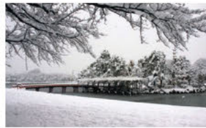
②은빛 눈에 덮인 덴노가와 공원 (눈 풍경)