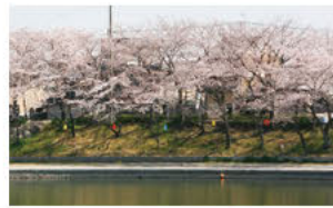
⑤봄빛 만발한 벚꽃 연회길 (제방의 벚꽃 가로수)