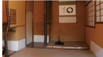
다실(훗타 가문 저택)

첫 다회 외에도 새해 첫 꿈이나 첫 웃음 등, 새해에는 '첫'이 붙는 말이 많지만, 그 중에서도 빼놓을 수 없는 행사가 바로 첫 참배입니다. 역병과 재난을 쫓는 장수와 행복의 신, 고즈텐노(우두천왕) 신앙의 총본산인 쓰시마 신사는 정월 3일에만도 약 30만 명의 사람이 방문합니다. 또한 1월 4일부터 7일에 걸쳐 개최되는 니기미타마샤 예제의 '띠 고리 통과하기'는 쓰시마 신사의 신년 행사로, 신사에 세워진 띠 고리를 통과하면 1년 동안 건강하고 무탈하게 지낼 수 있다고 전해집니다.