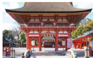
도요토미 히데요시가 기증한 누문