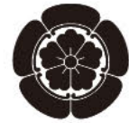
쓰시마 신사의 문양

도쿠가와 이에야스의 아들인 마쓰다이라 다다요시의 부인 마사코가 기증한 본전