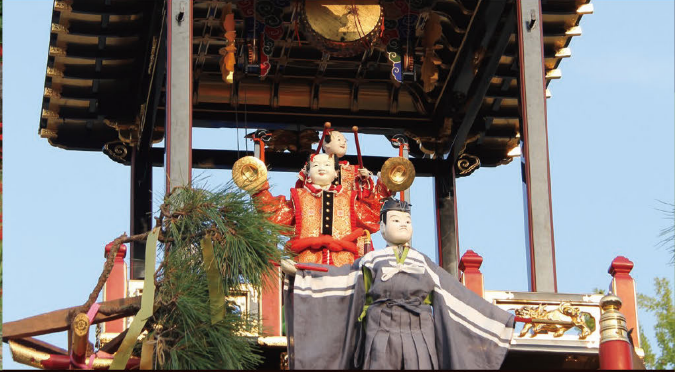
오와리 쓰시마 아키마쓰리 꼭두각시의 최고 기예

오와리 쓰시마 아키마쓰리는 10월 첫째 일요일과 그 전날인 토요일에 개최되며, 남녀노소 할 것 없이 시내를 축제 분위기에 휩싸입니다. 마쓰리에서는 나나키리, 무카이지마, 이마이치바, 가모리의 4개 지구에서 호화찬란한 수레 16대가 활기차게 오가는데, 그중에서도 눈길을 끄는 것이 꼭두각시 인형입니다. 쓰시마 하야시의 곡조에 맞춰 움직이는 모습은 변화무쌍하여 글자를 쓰는 것, 하늘을 나는 것 등, 박진감 넘치는 연기로 관중을 매료시킵니다.