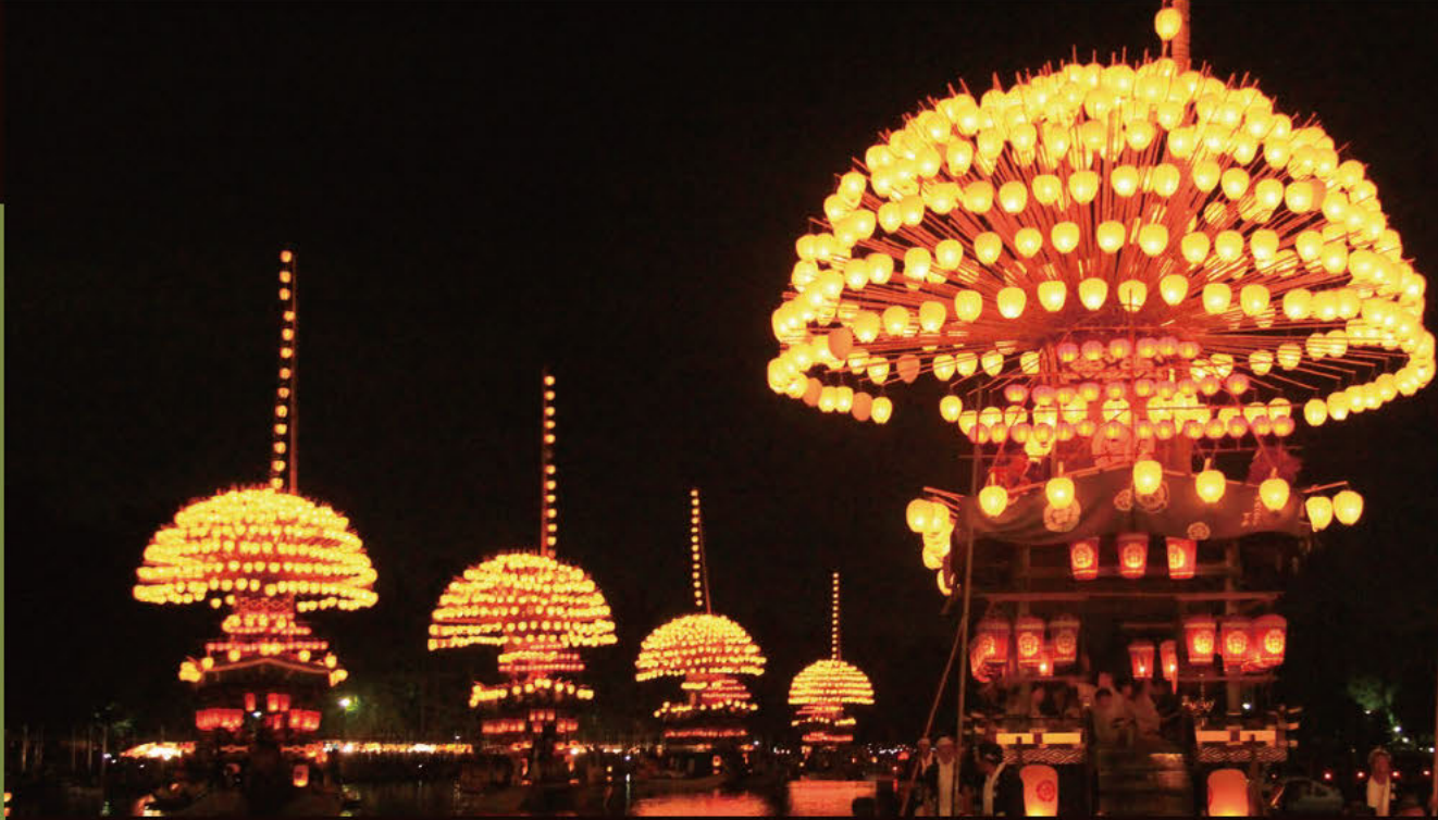
오와리 쓰시마 덴노마쓰리 등불과 물의 드라마오와리 쓰시마 덴노마쓰리

일본 3대 강 축제 중 하나로 손꼽히는 '오와리 쓰시마 덴노마쓰리'는 전국의 수많은 여름 축제 중에서도 가장 화려하다고 합니다. 쓰시마 신사의 제례로 600년 가까운 전통을 자랑하며, 오다 노부나가도 구경했다는 기록이 있습니다. '오와리 쓰시마 덴노마쓰리의 단지리부네 행사'는 국가 중요 무형 민속문화재로 지정되어 있으며 2016년 12월 1일에 '야마·호코·야타이 행사'의 하나로 유네스코의 무형문화유산으로 등록되었습니다. 7월 넷째 토요일에 '밤 축제', 다음 날인 일요일에 '아침 축제'가 거행됩니다.