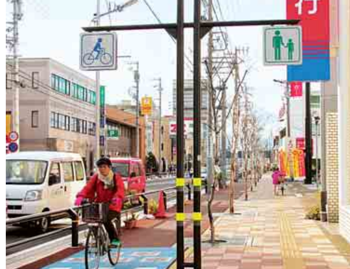
自転車歩行者道を整備した県道名古屋・津島線 Prefectural road with improved bicycle and pedestrian lane (Nagoya-Tsushima Line)

市内に生息する植物や昆虫、鳥・魚などの観察会を開催しています。また、水質や空気の調査をとおして、環境保全や観察の大切さを行政に提言しています。この他にも、環境美化や地球温暖化、新エネルギーの勉強会などを通じて市や周辺の環境について考えています。今後、視点を変えた活動を展開していくためにも、新しいメンバーが必要となってきています。老若男女を問わず、多くの人に参加してもらい、みんなで津島市の環境をよくしていきたいですね。