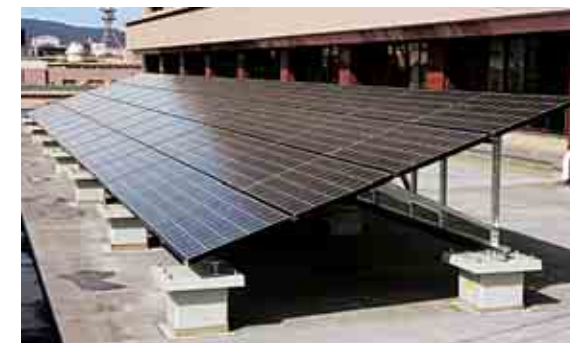
太陽光発電 Solar power generation

市民や各種団体のボランティアによる活動で、ポイ捨て等のごみの一斉清掃を年2回実施しています。