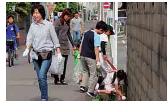
ごみゼロ運動 No Trash Campaign

Tsushima abounds in the beauty of nature, including Tennohgawa Park, with cherry blossoms, wisteria, water lilies, and maple trees ushering in the changes of season. Citizens have undertaken initiatives to preserve and enjoy the beautiful natural surroundings. An awareness of environmental conservation and development has been growing in importance, which is evident in the appointment of Tsushima City environmental commissioners and the No Trash Campaign. The city also values the development of its pleasant, bountiful waterways.