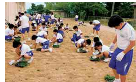
中学校芝生化事業 Project to turf junior high school sports grounds

再生可能エネルギーの普及と拡大のため、家庭用太陽光発電の設置を補助しています。また、小学校の屋上など、施設への設置を進めています。