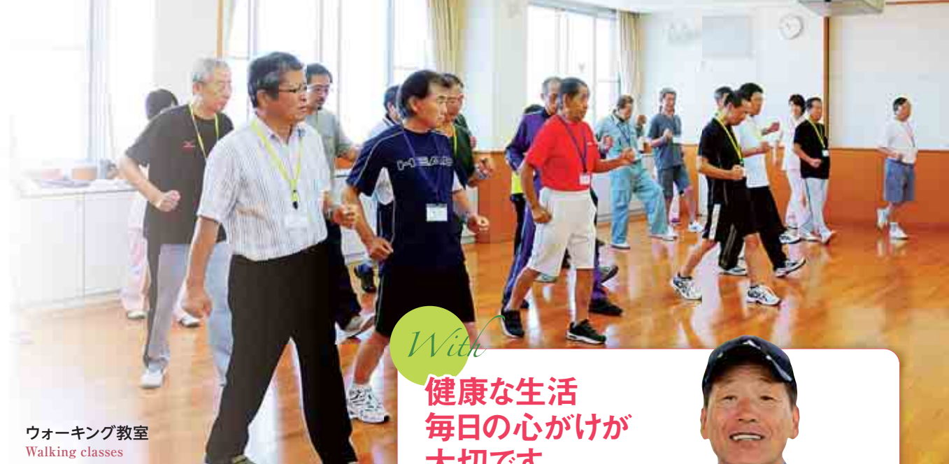
ウォーキング教室 Walking classes

地域の診療所との連携を強化し、住み慣れた地域や自宅で安心して過ごせる医療の体制を整えています。