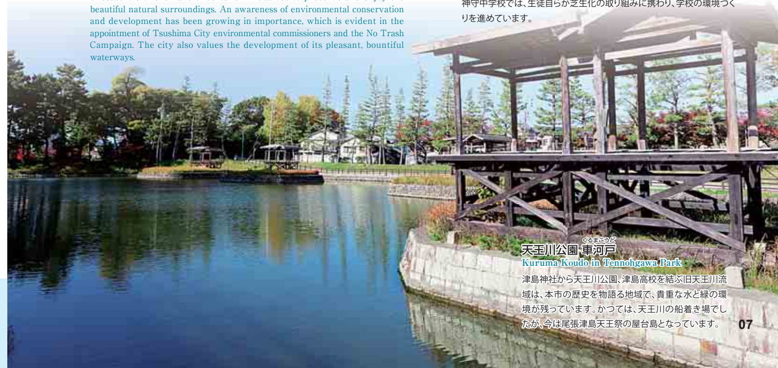
天王川公園 車河戸 Kuruma Koudo in Tennohgawa Park

神守中学校では、生徒自らが芝生化の取り組みに携わり、学校の環境づくりを進めています。