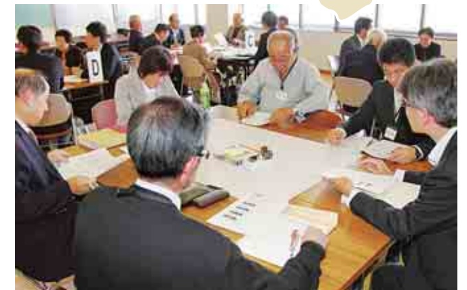
津島市協働のまちづくり基本方針策定委員会 Committee for Tsushima City Community Development Policy Planning 委員会は学識経験者や市民活動団体などで構成され、協働のまちづくり推進の基本的な考え方や、市民活動の推進施策について検討しました。

Community is the driving force behind the development of Tsushima City. In particular, the Community Promotion Council provides opportunities for citizen involvement in activities and initiatives to resolve issues within the communities related to organizing local festivals, running cleanup campaigns, and offering traffic safety and disaster and crime prevention classes. Citizen-led community development is supported by the government; together we strive to achieve cooperative community development.